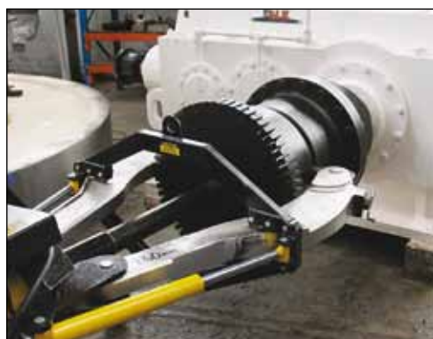
◀ Съемник EPH-1002E легко удаляет этот шкив с вала.